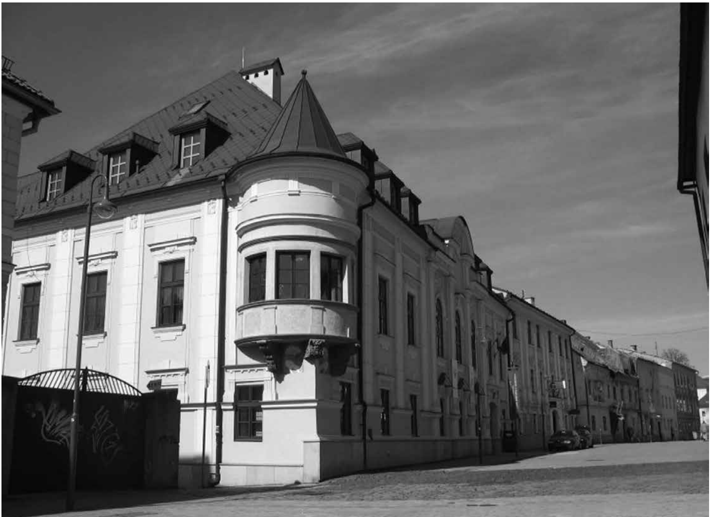
Štúdio D 44 si našlo miesto v budove Štátnej vedeckej knižnici v Lazovnej ulici v Banskej Bystrici.