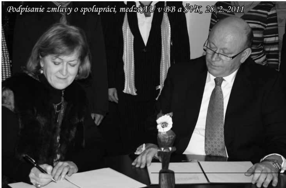
Podpísanie zmluvy o spolupráci, medzi AU v BB a ŠVK, 28. 2. 2011