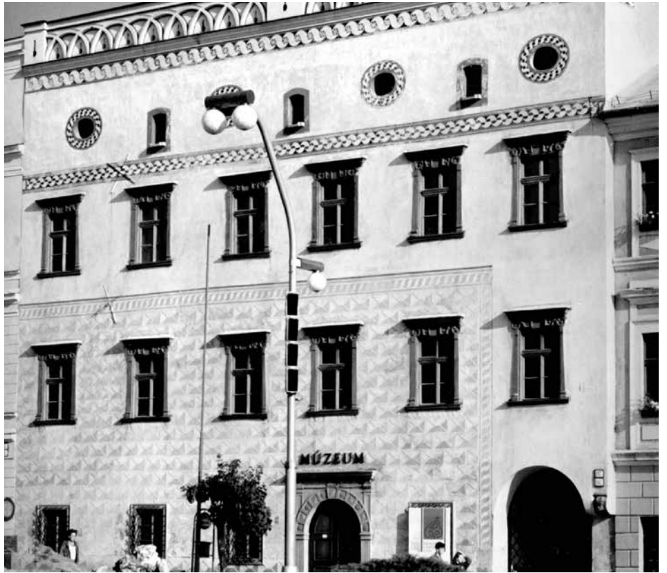
Thurzov dom na Námestí SNP v Banskej Bystrici, kde je dnes Stredoslovenské múzeum.

Zdôraznil, že jeho ambíciou bolo predovšetkým oboznámiť nášho súčasníka s osudmi tohto pozoruhodného rodu. Film je rekapituláciou života,