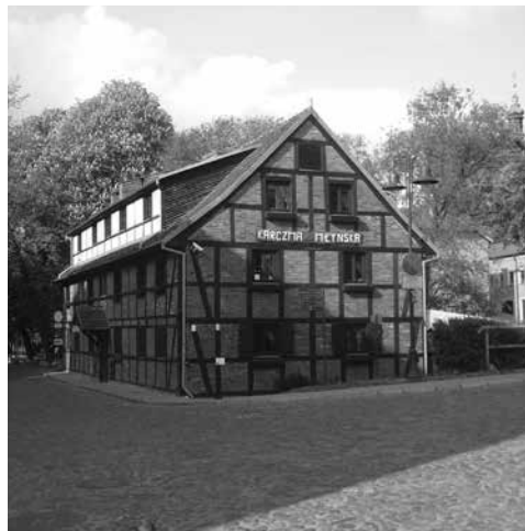
Hrazdená nemecká architektúra v blízkosti opery