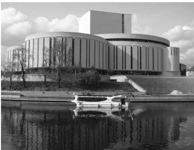
Budova opery na brehu rieky Brda